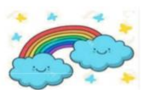
ARCO+BALENO ARCOBALENO nome + nome