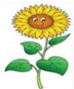
GIRA+SOLE GIRASOLE verbo + nome