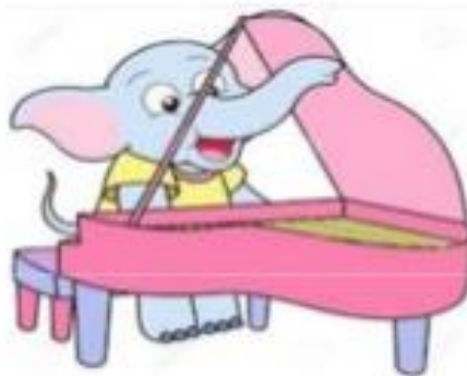
PIANO+FORTE PIANOFORTE aggettivo + aggettivo